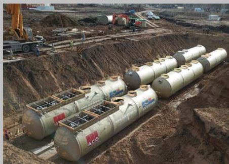
КОС ЭКО-Р-1000, ЖК "Цветы Башкирии", г. Уфа